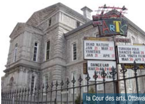
la Cour des arts, Ottawa

* Invité – Les heures, descriptions et conférenciers des séances sont sujets à changement.