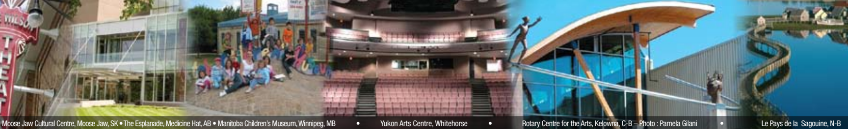
Moose Jaw Cultural Centre, Moose Jaw, SK • The Esplanade, Medicine Hat, AB • Manitoba Children's Museum, Winnipeg, MB